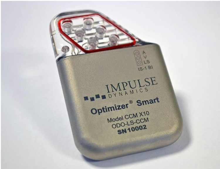
Abbildung 1: OPTIMIZER Smart IPG