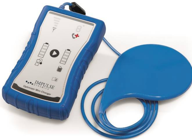
Figura 2: OPTIMIZER Mini Charger

L-OPTIMIZER Mini Charger jaħdem permezz ta' batterija li tista' tiġi ċċarġjata wkoll. Iċ-charging wand hija mwahħla b'mod permanenti mal-apparat b'kejbil li hu twil biżżejjed biex iħallik tissettja ċ-charger għal distanza sa 0.5 m (~20 pulzier) 'il bogħod minnek. Il-proċess tal-iċċarġjar jaħdem b'mod awtomatiku mingħajr ma jeħtieġ intervent sinifikanti mill-utent. Jekk jogħġbok irreferi għat-Taqsima 7 ta' dan il-manwal għal dettalji dwar it-thaddim xieraq taċ-charger.