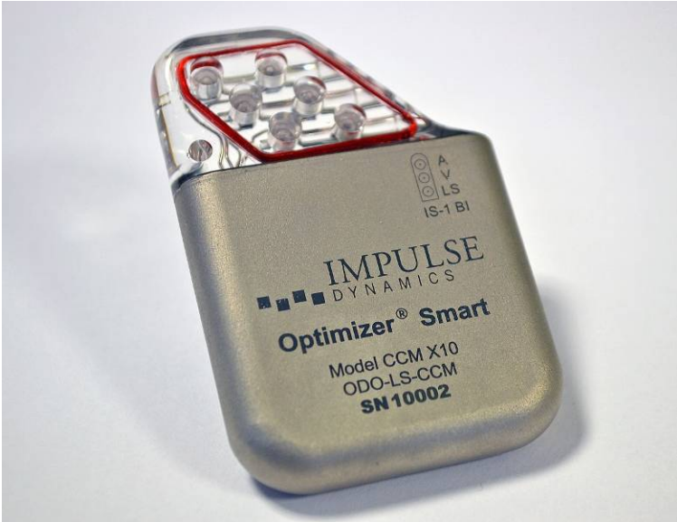
Figura 1: OPTIMIZER Smart IPG