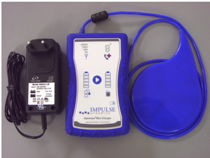
Figura 3: OPTIMIZER Mini Charger bl-AC Adapter