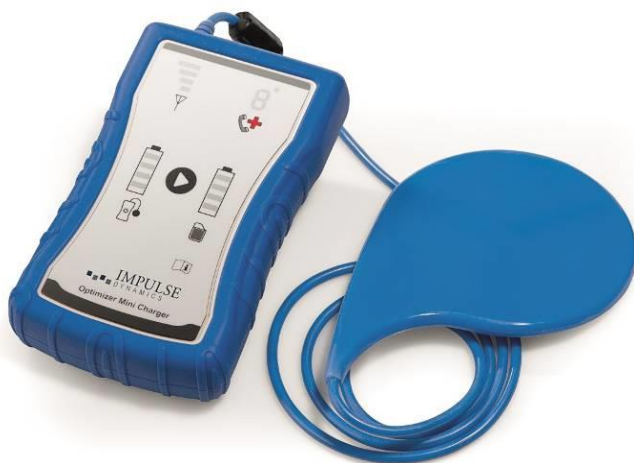
Рисунок 2. Зарядное устройство OPTIMIZER Mini Charger

Питание устройства OPTIMIZER Mini Charger также осуществляется от аккумулятора. Зарядный зонд постоянно соединен с зарядным устройством кабелем, длина которого позволяет пациенту располагать это устройство на расстоянии до 0,5 м (~20 дюймов) от себя. Процесс зарядки проходит автоматически, без существенного вмешательства пользователя. Подробнее о надлежащем использовании зарядного устройства см. в разделе 7 данного руководства.