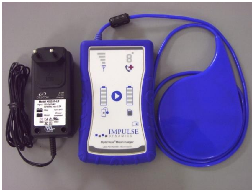
Рисунок 3. OPTIMIZER Mini Charger с переходником для подключения к источнику переменного тока