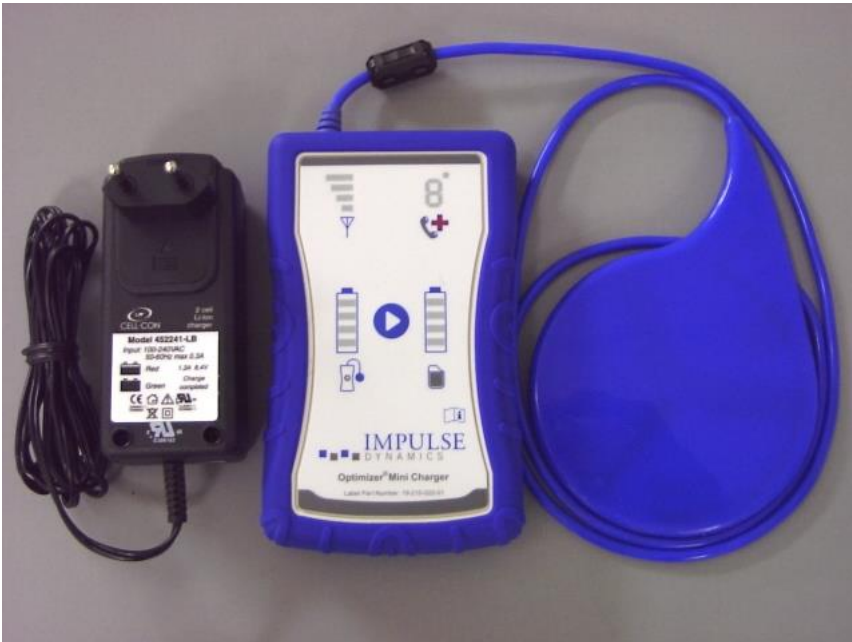
Figura 3: Minicargador OPTIMIZER con adaptador de CA