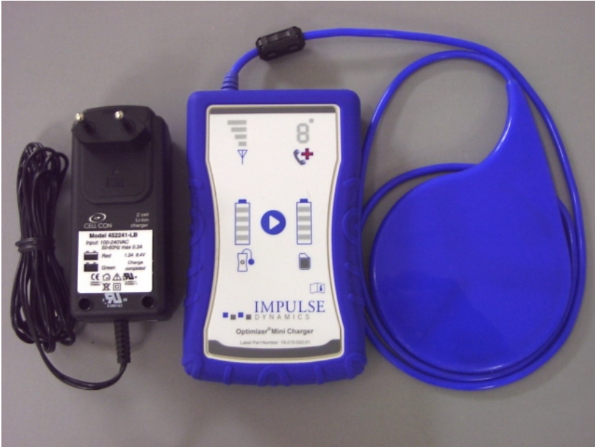
Figura 3: Minicargador OPTIMIZER con adaptador de CA